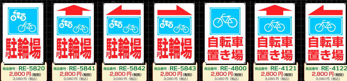
看板素材 プラスチック板 (PP製) 厚さ1mm / 45×30cm【穴4箇所】

+1,200円(税別)で、アルミ複合板 厚さ3mm / 45×30cm【穴4箇所】に変更できます。商品番号の後にBをつけてください。例 RE-4200B